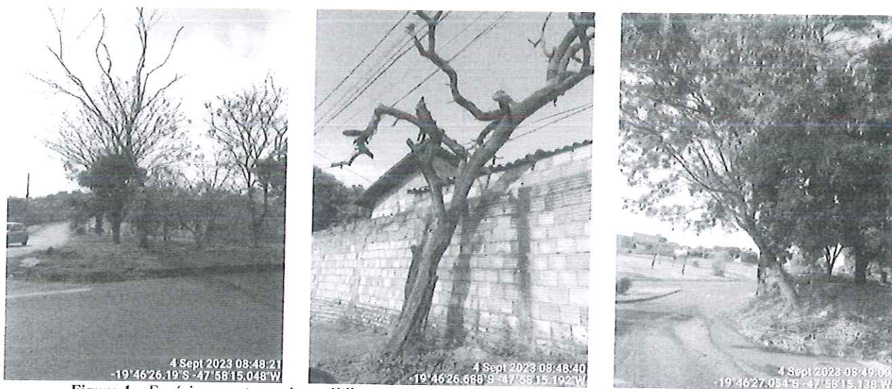
Figura 1 – Espécime morto em área pública; e outro na calçada; e por fim, as leucenas.

Diante da situação, recomendamos o desmonte dos espécimes mortos e a supressão das leucenas. Para tanto, encaminhamos a presente solicitação para a Secretaria de Serviços Urbanos e Obras para conhecimento e execução.